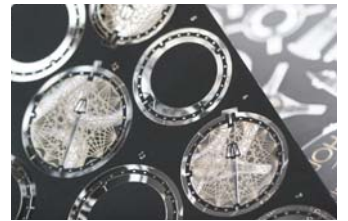
▲エッチングにより溶けた部分が透けて見える。