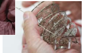
▲幾何学模様の隔壁を順番に組み込んでいく。