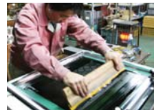
▲シルク印刷でチタン板にマスクング加工を施し、マスクされていない部分を溶かしてそれぞれのパーツをつくる。