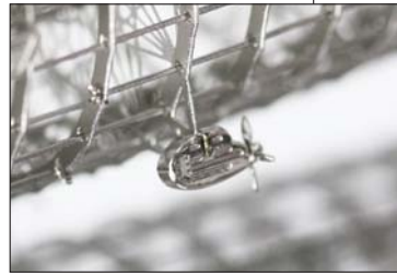
▲クルクルと回るプロペラまでオールチタン製

20世紀初頭に空の旅を実現した夢の飛行船を、チタン加工技術を集結させ1/500のサイズで造り上げたのがこのツェッペリン模型。チタン素材だけを使って骨組みモデル風に精巧に造られています。大きな夢を高い技術で表現したオブジェを、ぜひお手元においてお楽しみ下さい。