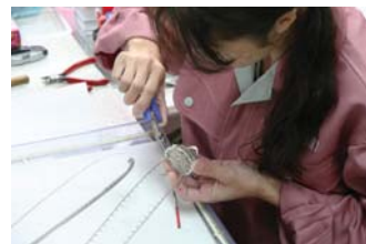
▲固定方法はボンドなどは使わず、部品の先端をベンチで折り曲げ固定していく。