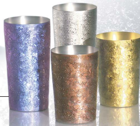
チタン2重タンブラーPREMIUM チタン天目シリーズ